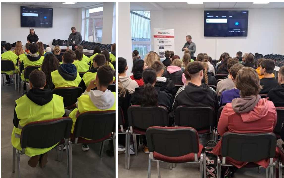
Foto: exkurze ve firmě CEBES