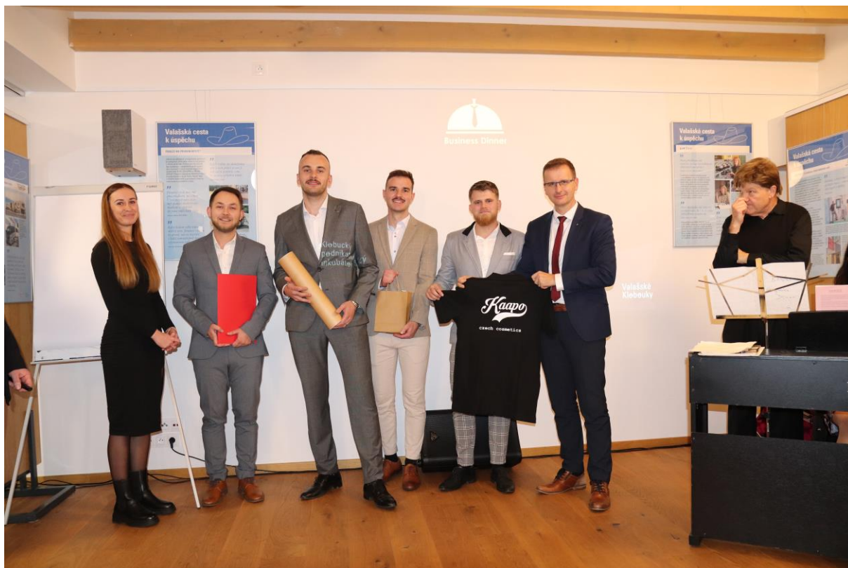
Úspěšní start-upisté z akcelérátoru Můj první milion v roce 2023 a 2024 s panem hejtmánem ZK

V poslední networkingové části mohli účastníci naplnit její hlavní poslání, kterým je budování partnerství a podnikatelské komunity v našem regionu.