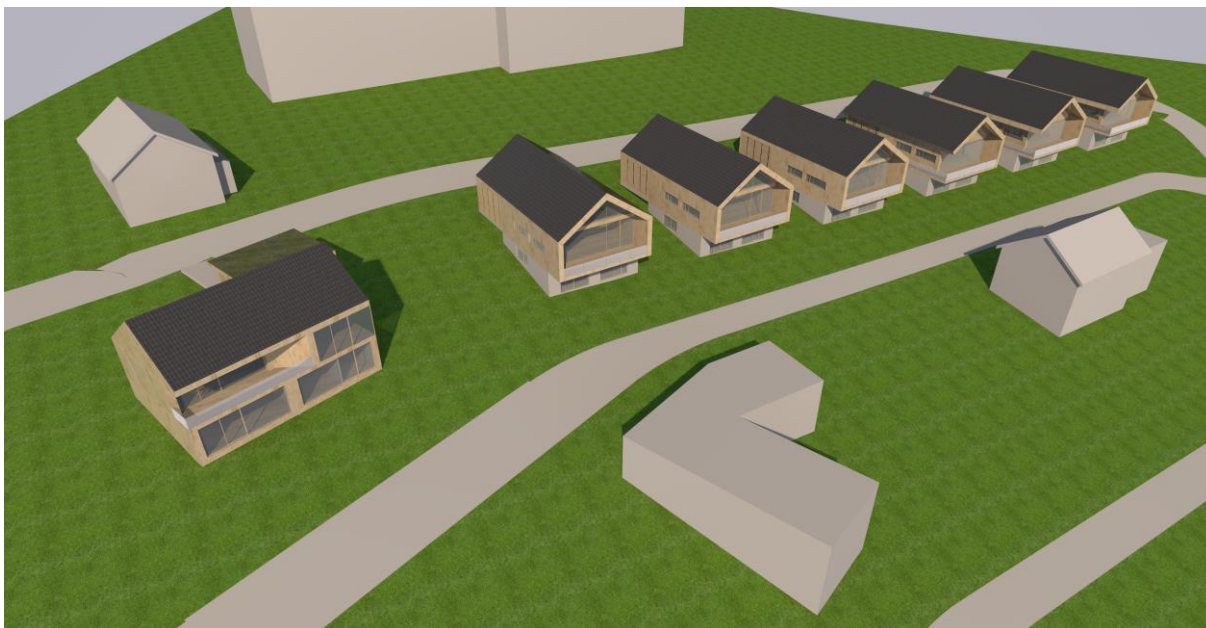
Hmotová studie zástavby greenfieldu na Dlouhé