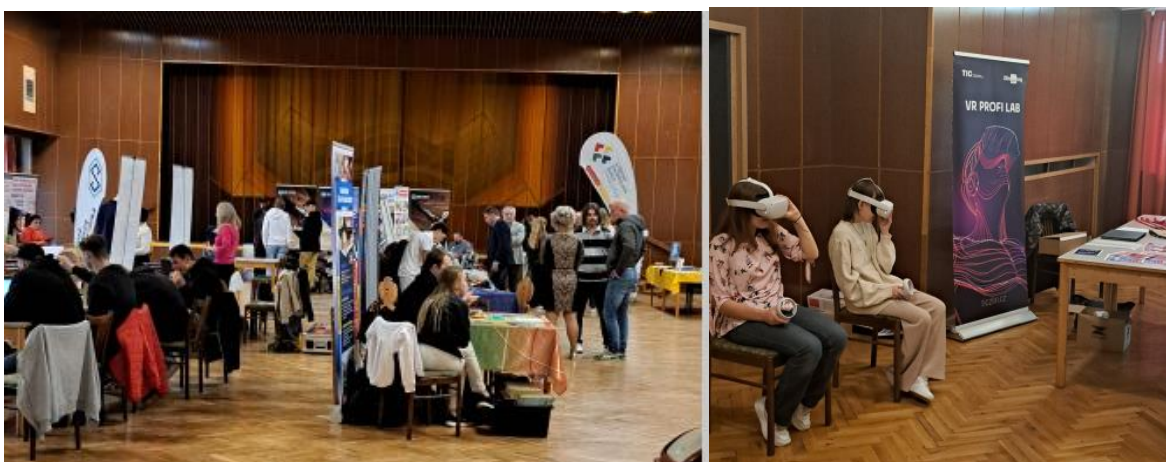
Foto: Veletrh zaměstnanosti s burzou středních škol

Svět se mění a pracovní uplatnění s ním. Proto realizujeme stálou kampaň Technodays. Smyslem celé kampaně je ukazovat žákům základních škol z našeho regionu perspektivní obory pro jejich uplatnění, perspektivní firmy jako jejich potenciální zaměstnavatele a napomáhat tak budoucí úspěšné profesní kariéře mladých lidí u nás v regionu. Tuto kampaň spoluorganizuje VPC spolu s MAS Ploština. V roce 2024 se do kampaně zapojilo přes 250 žáků z pěti základních škol v územním pokrytí působnosti MAS Ploština. Navštívili jsme firmy dle výběru studentů ZŠ, a to SumiRico AVS v Dřnovicích, DGS plast v Loučce, TVD v Rokytnici a místní firmu Eurocorp trade. Speciální den byl věnován firmě CEBES, která slavila výročí 30 let od založení firmy. V rámci tohoto výročí proběhl i Den otevřených dveří, kde si mohla i široká veřejnost prohlédnout prostory firmy a svěst se i elektromobily, do kterých dodává firma komponenty.